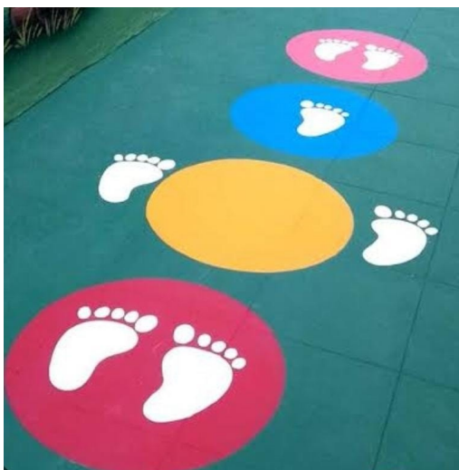
Imagem 03: Pintura no chão atividades escolares Círculos de 40cm diâmetro, comprimento total 2,20m.

Serão adquiridos conjuntos esportivos para futsal com par de traves oficiais de 3,00x2,00 em tubo de aço galvanizado 3" com requadros em tubo 1", pintura em primer com tinta esmalte sintético e redes de polietileno fio 4mm.