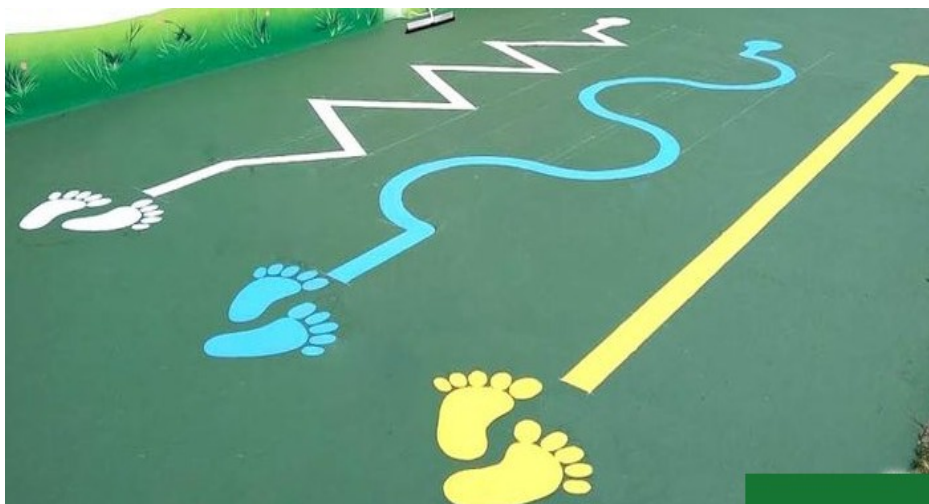
Imagem 02: Pintura no chão atividades escolares Dimensões linhas 10cm , pés 30cm e comprimento, caminho 2,20.